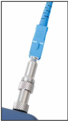
SC (APC opcional)

Admite 8 tipos de interfaces de fibra óptica.