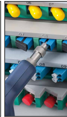
SC hembra (APC opcional)