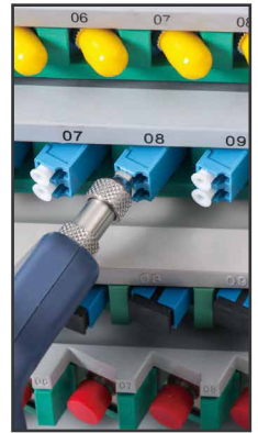
LC hembra (APC opcional)